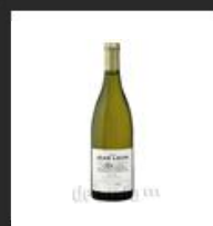
Chardonnay "Vinya Gigi"